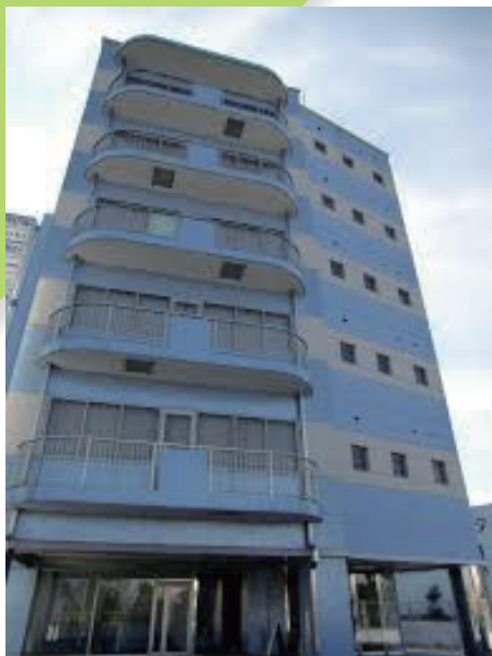
日本語学校つくばスマイル様